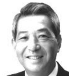
松浦 防府市長 兼 ケーブル役員